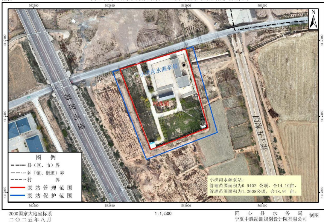
1-5 同心县小洪沟水源泵站管理与保护范围划定成果影像示意图