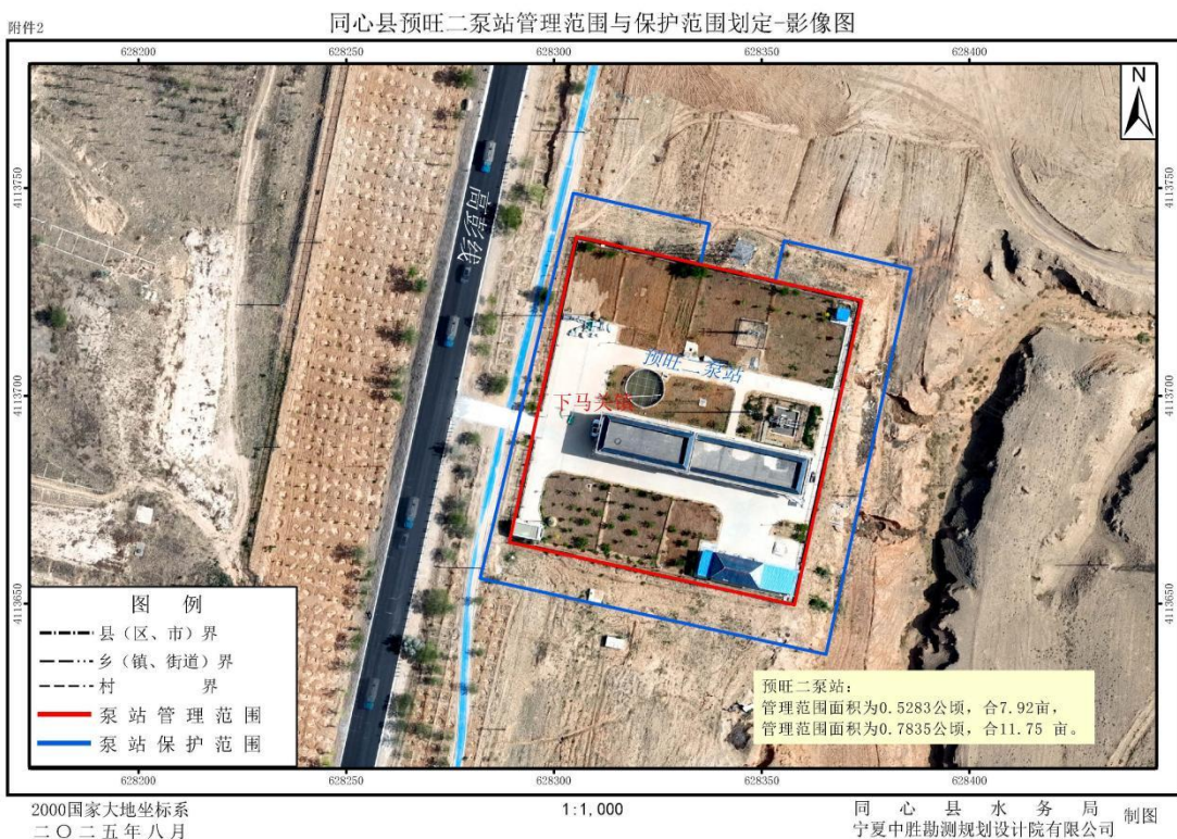
1-2 同心县预旺二泵站管理与保护范围划定成果影像示意图