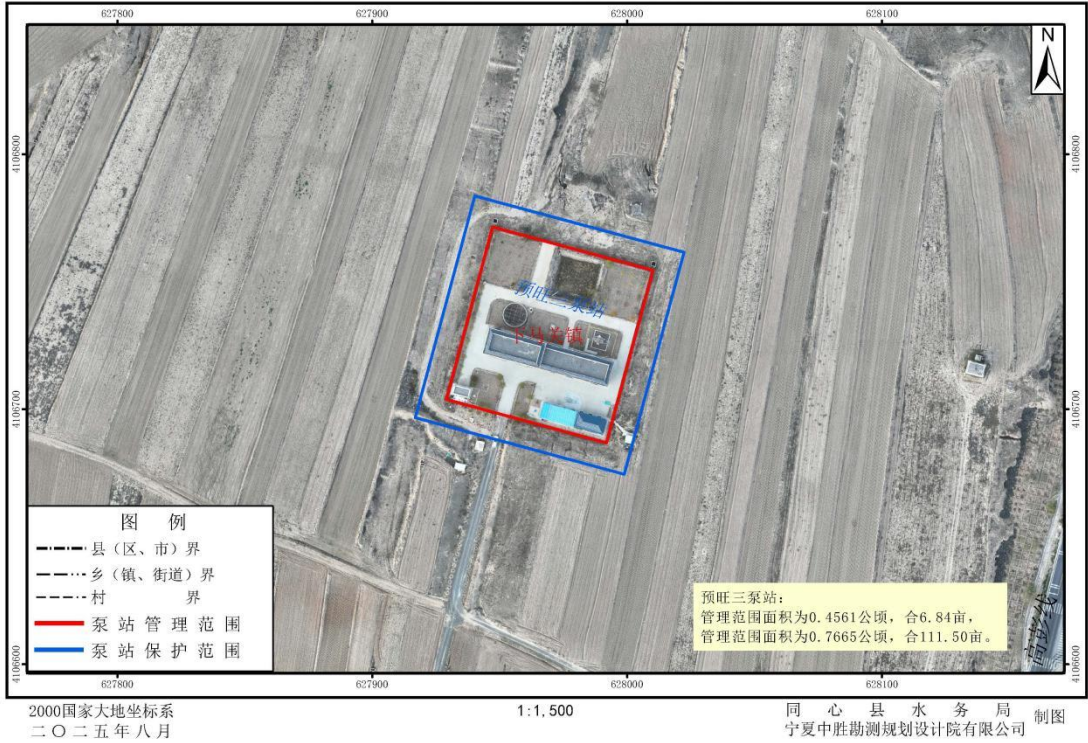
1-3 同心县预旺三泵站管理与保护范围划定成果影像示意图