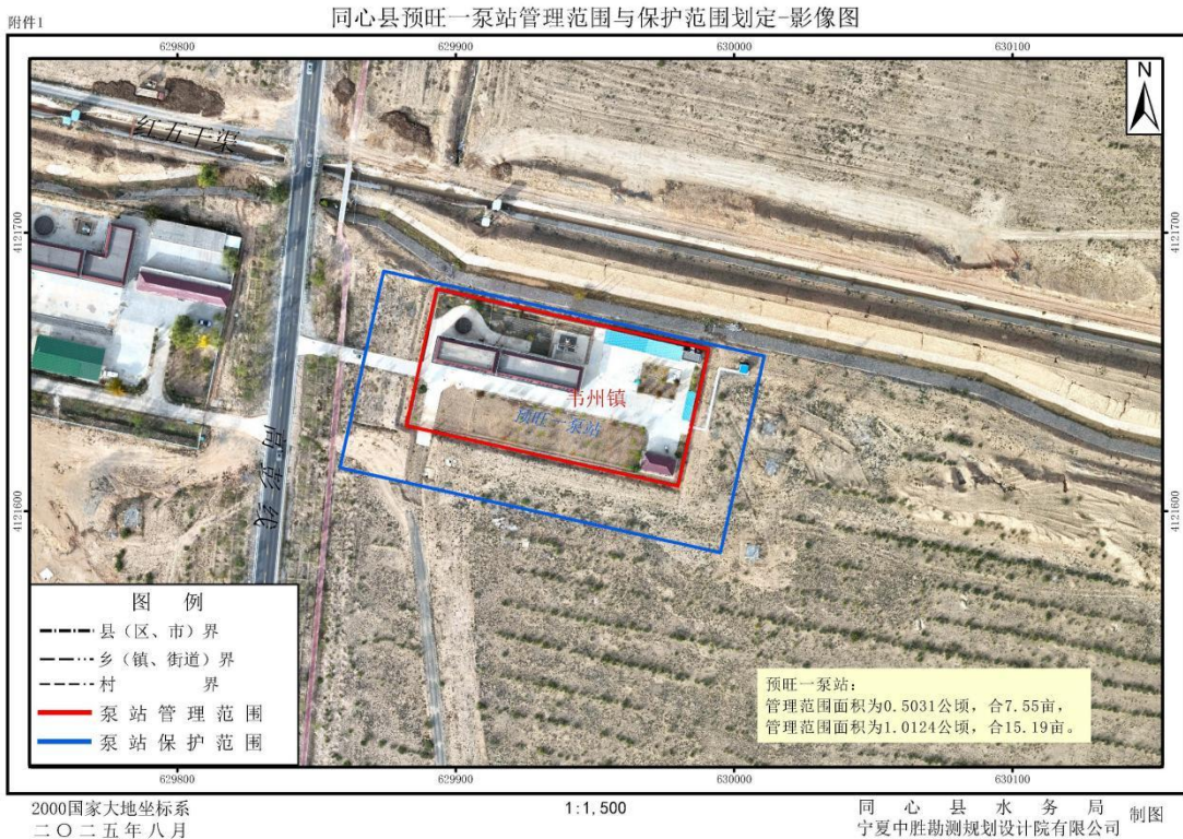
1-1 同心县预旺一泵站管理与保护范围划定成果影像示意图