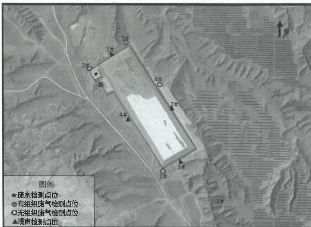
图 1 检测点位示意图