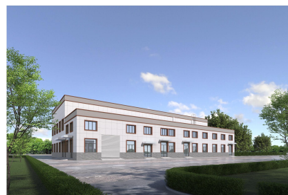
11#综合业务用房透视图