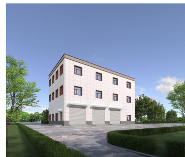
6#污泥脱水间透视图