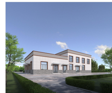
1#细格栅间及沉砂池透视图